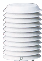
温度・湿度センサー ※JIS準拠製品