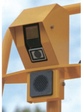
3Dセンサ 後方カメラ 後方用スピーカ