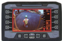
運転席用ディスプレイ

運転者の“まさか・うっかり”などのヒューマンエラー防止を 補助する緊急ブレーキ装置(後進用)を搭載した専用機